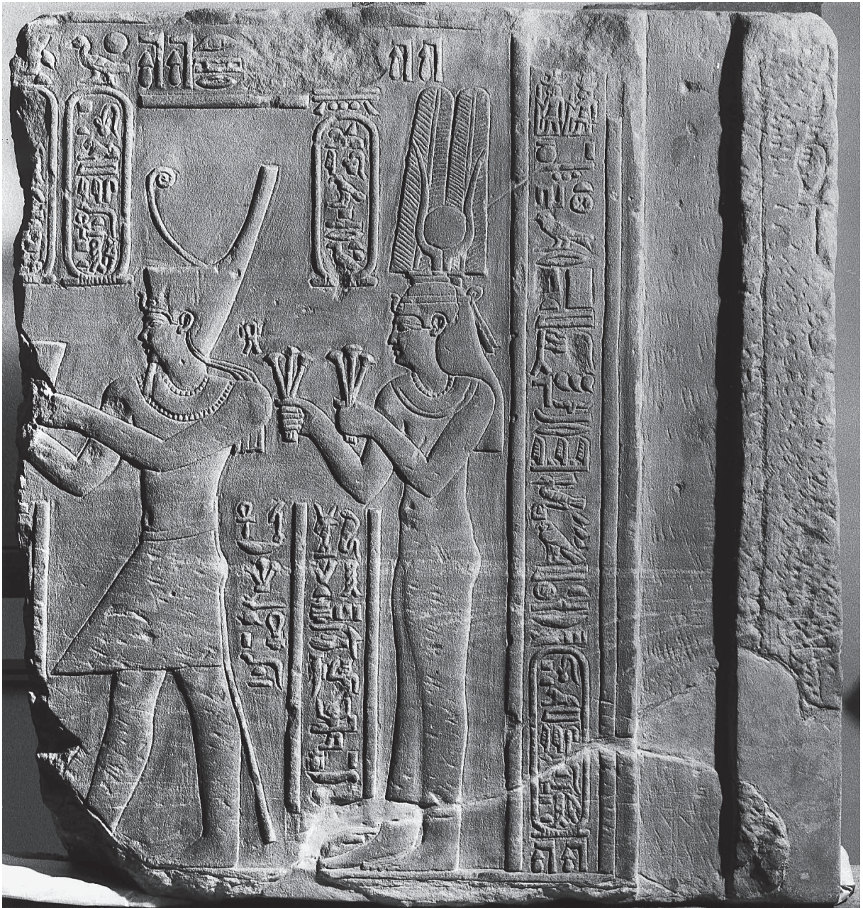
Fig. 1. Le bloc Berlin Inv. 2116.